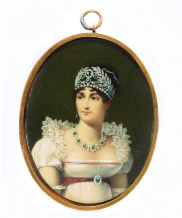
Portrait miniature de Josephine Bonaparte, Jean-Baptiste Isabey, 1808. Fürstlich Hohenzollernsche Sammlungen.

visiteur reste ébahi devant une broche où l'or et les pierres précieuses enserrent un camée représentant un Bonaparte hiératique ou une bague brillant de mille feux ayant appartenu à son beau-fils Eugène de Beauharnais. Plus sobre encore est un altier diadème composé d'épis de blé évoquant la déesse des moissons Cérès illustrant la fascination pour l'Antiquité – également perceptible dans l'habillement – qui vit le jour avec le Directoire et se poursuit au cours du Premier Empire.