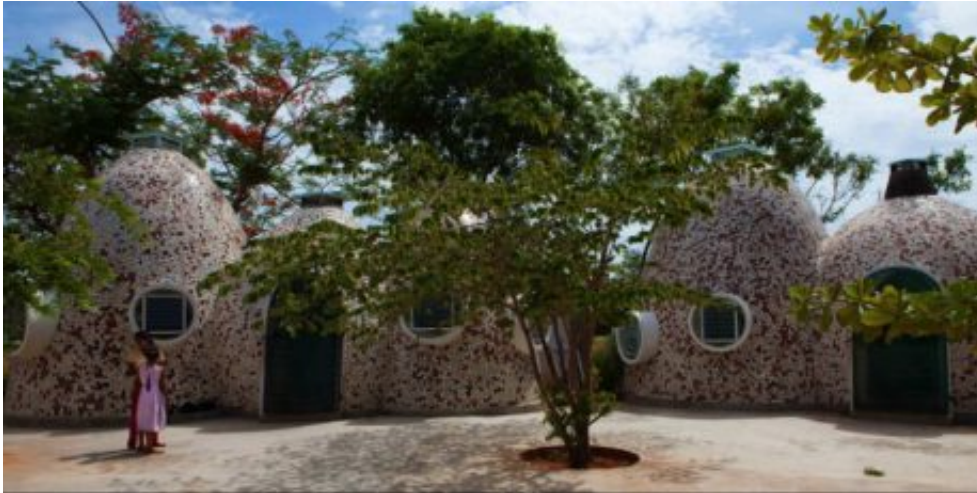
Volontariat Home for Homeless Children, Pondicherry, India, 2010 © Deepshikha Jain

formes puisant dans un patrimoine commun (Casa das Histórias Paula Rego à Lisbonne), édifice se détachant comme un empilement de lames dans le paysage (stade municipal de Braga / Estádio Axa) ou encore reconversion à couper le souffle du Couvent des Barnardas, monument historique du XVI e siècle, il touche à tout avec brio.