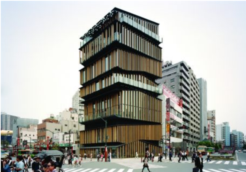
Asakusa, Tourist Information Center / Kengo Kuma & Associates, © Takeshi Yamagishi

08/10, CGR, Colmar et Die Neue Nationalgalerie , 22/10, Kino Studio 3, Karlsruhe). Autre moment devenu culte, les midi-visites guidées par une personnalité, sandwich en main, et les parcours vélo. L'occasion de (re)découvrir l'Héliodome de Cosswiller (12 & 13/10), habitat jouant de la révolution solaire pour être en phase avec la nature ou encore de parcourir des lieux en reconversion : Les Dominicains de Colmar (10/10), la Malterie et le Palais Fischer, futurs cinéma MK2 (Schiltigheim, 12/10), le chantier Mur d'escalade à DMC (Mulhouse, 14/10) et celui de la Maison Llauro en bois brûlé (Mulhouse, 15/10). Last but not least , ne manquez pas la fameuse fête du Tankturm 2019, ancien château d'eau ferroviaire restructuré qui mêlera archi, littérature et musique (Heidelberg, 12/10) jusqu'au bout de la nuit.