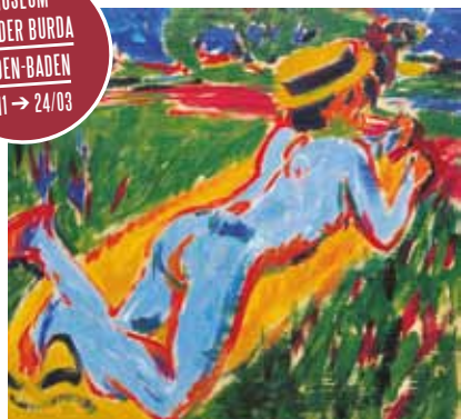
Ernst Ludwig Kirchner, Nu couché bleu avec chapeau de paille (Liegender blauer Akt mit Strohhut, 1909, collection privée Privatsammlung, Brücke-Museum Berlin

MUSEUM FRIEDER BURDA BADEN-BADEN 17/11 → 24/03