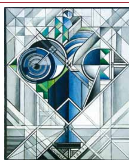
André Evard, Roses bleues Blau Rosen , 1924