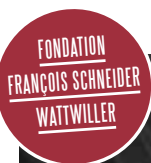
Photo. Arrêt sur images (bis 28.10.) präsentiert die Bilder von Jean-Luc

Photo. Arrêt sur images (jusqu'au 28/10) présente les images de Jean-Luc Heili : mammifères, oiseaux et reptiles dans leur milieu naturel.