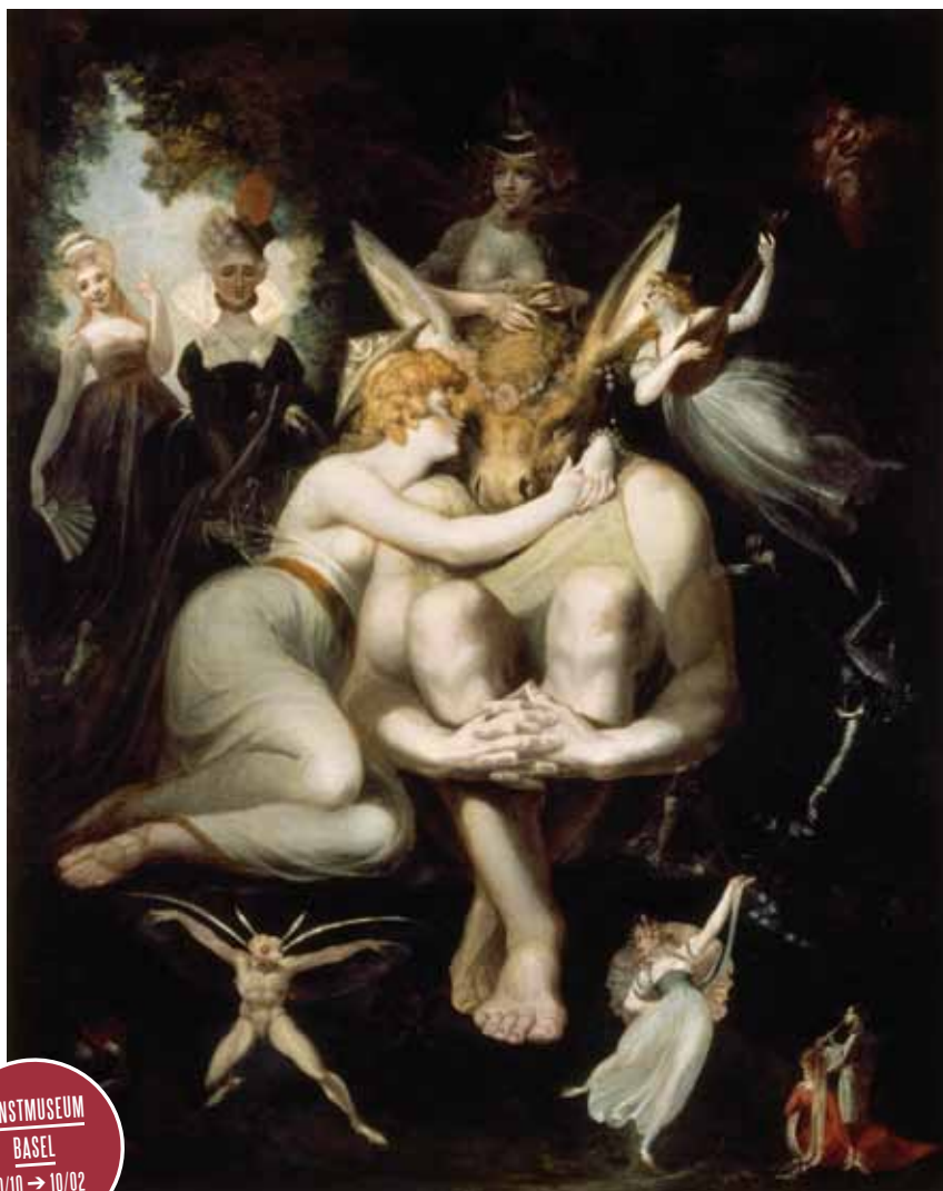
Titania cajole Zettel Titania liebkost Zettel, 1793/94