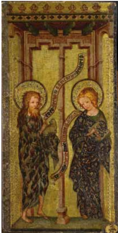
Photo de von Martin P. Bühle © Kunstmuseum Basel, Dauerleihgabe aus Privatbesitz