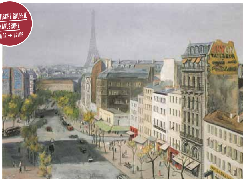
Wilhelm Schnarrenberger, Boulevard Montparnasse , 1931, collection particulière, Privatbesitz © VG Bild-Kunst, Bonn 2018