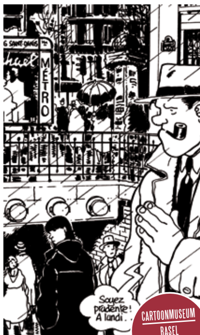
Tardi, Nestor Burma, 1982-2000