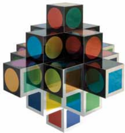
Kroa-MC, 1969, Vasarely Múzeum, Budapest © VG Bild-Kunst, Bonn 2018. Photo : Szépművészeti Museum, Budapest, 2018