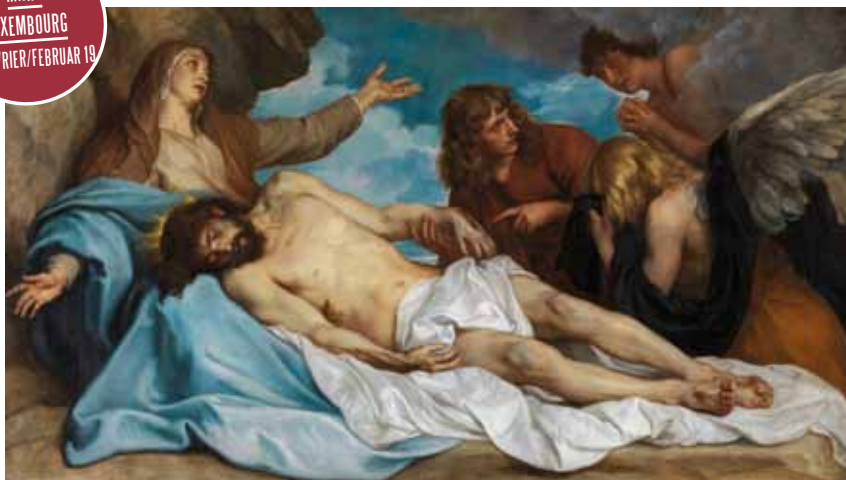
Anthony van Dyck, La Lamentation du Christ Die Beweinung Christi , vers um 1635, Koninklijk Museum voor Schone Kunsten Antwerpen (KMSKA)

Außergewöhnlich 1. Die Ursprünge der chinesischen Zivilisation (21.11.-28.04.) präsentiert die archäologischen Schätze der Dynastien Yia, Shang und Song.