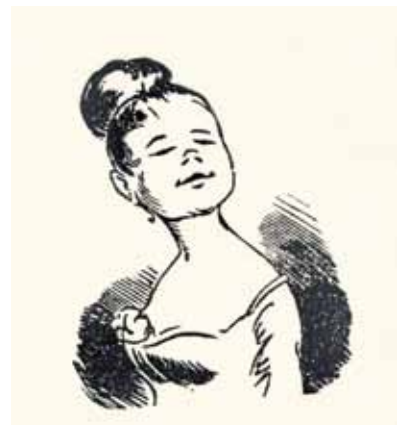
Wilhelm Busch, „Helchen wächst und wird gescheid Und trägt bereits ein langes Kleid ...“ aus: Die fromme Helene (1872)

« La petite Helène grandit et murit Et commence déjà à porter une robe longue... » de : Hélène la pieuse (1872)